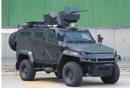
12.7 mm AÇIK KULELİ ZIRHLI PERSONEL TAŞIYICI