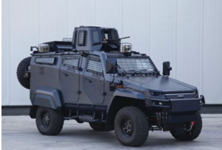
7.62 mm KAPALI KULELİ ZIRHLI PERSONEL TAŞIYICI