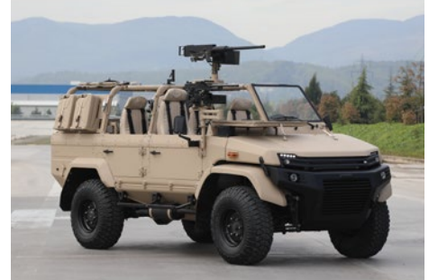
ÖZEL HAREKAT ARACI