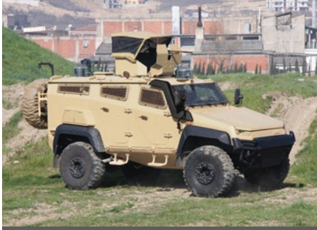
7.62 mm AÇIK KULELİ ZIRHLI PERSONEL TAŞIYICI