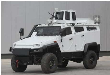
ZIRHLI İÇ GÜVENLİK ARACI