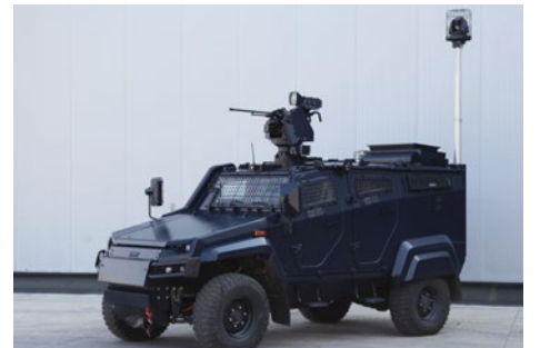
UZAKTAN KUMANDALI SİLAH SİSTEMLİ ZIRHLI PERSONEL TAŞIYICI