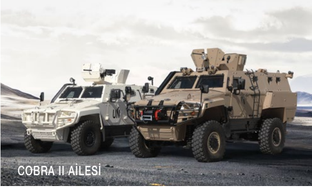
COBRA II AİLESİ